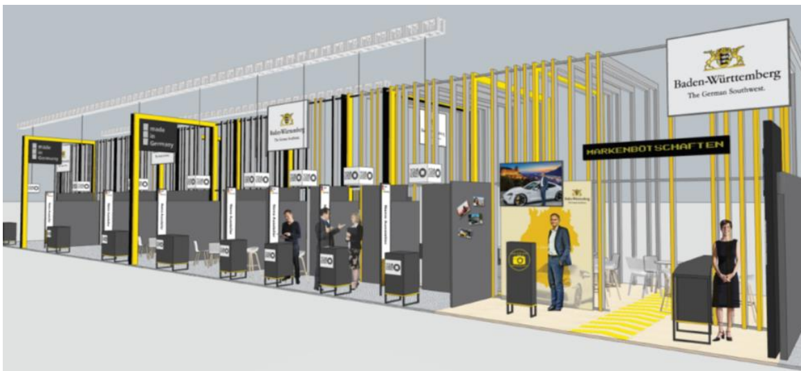
Ausstellerfläche (links), Gemeinschaftsfläche (rechts)

(Beispielbilder - Anpassungen auf Grund der Hygienekonzepte der Veranstalter möglich)